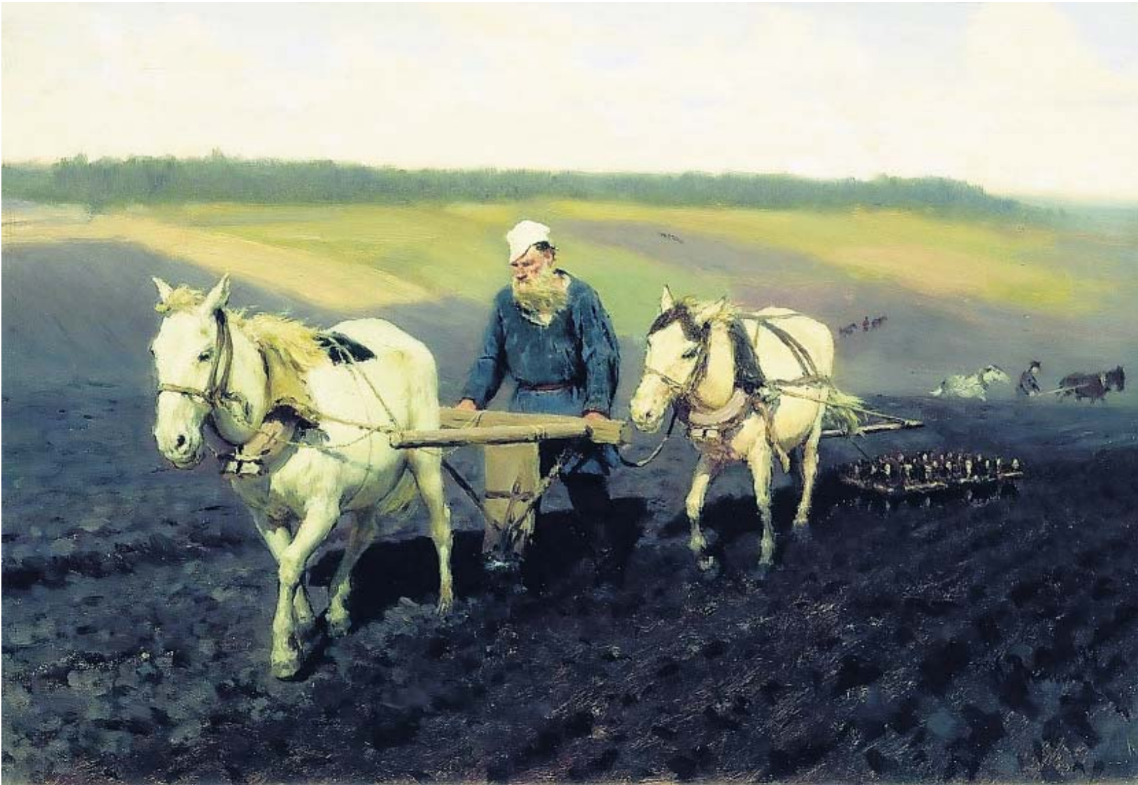
▲ Tolstoj achter de ploeg op een schilderij van Repin.

Een greep uit de activiteiten t/m 9 juni: De Sovjet Mythe, sociaal realisme 1932-1960 in het Drents Museum in Assen. 13 januari: Officiële opening Noord-Nederland Rusland 2013. 15 januari t/m 20 maart: Club Guy & Roni op tournee met L'Historie du Soldat. 27 januari, 10 februari, 31 maart en 12 mei: Russisch Ballet in Pathé. 4 t/m 8 maart: Leningrad Oblast week, economische activiteiten. 9 maart t/m 5 mei: Hallo St. Petersburg! Gronings-Russisch samenwerkingsproject van jonge kunstenaars in het Noordelijk Scheepvaartmuseum en de synagoge in Groningen. 14 t/m 17 maart: Het NNO speelt Prokovjev en Sjostakovitsj. 7 t/m 9 mei: Conferentie 400 jaar Nederlands-Russische betrekkingen. 29 mei: Energie Forum over de energiesamenwerking tussen Nederland en Rusland. 28 t/m 31 oktober: Noord-Nederland week in Sint Petersburg. 9 november en 8 december: Vespers van Rachmaninov. 21 t/m 30 december: Schaakfestival Groningen 2013 met veel Russisch schaaktalent. Een volledig overzicht van de activiteiten in Noord-Nederland is te vinden op www.nnr2013.nl en voor heel Nederland op www.nlrf2013.nl