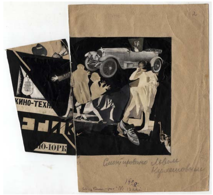
Leo Kuleshov. Kino-tekhnika (Film-technique). Photocollage. 1922