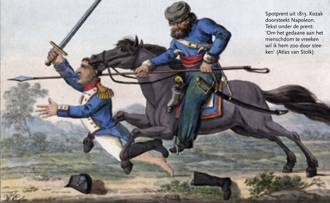
Spotprent uit 1813. Kozak doorsteekt Napoleon. Tekst onder de prent: 'Om het gedaane aan het menschdom te vreeken wil ik hem zoo door stee-ken'

De veldtocht naar Rusland door Napoleon was één grote mislukking: steden zoals Moskou en Smolensk brandden totaal af, er waren één miljoen doden te betreuren en Rusland bleef Russisch en geregeerd door tsaar Alexander. En een groot deel van Europa had genoeg van Napoleon.