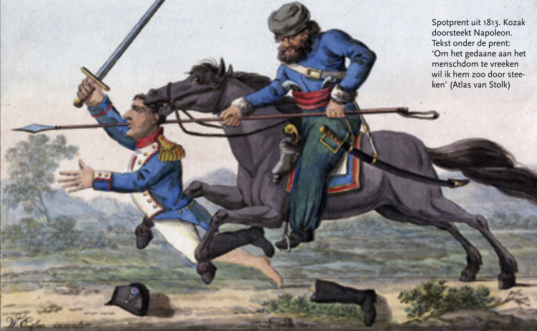
Spotprent uit 1813. Kozak doorsteekt Napoleon. Tekst onder de prent: 'Om het gedaane aan het menschdom te vreeken wil ik hem zoo door steecken'

De veldtocht naar Rusland door Napoleon was één grote mislukking: steden zoals Moskou en Smolensk brandden totaal af, er waren één miljoen doden te betreuren en Rusland bleef Russisch en geregeerd door tsaar Alexander. En een groot deel van Europa had genoeg van Napoleon.